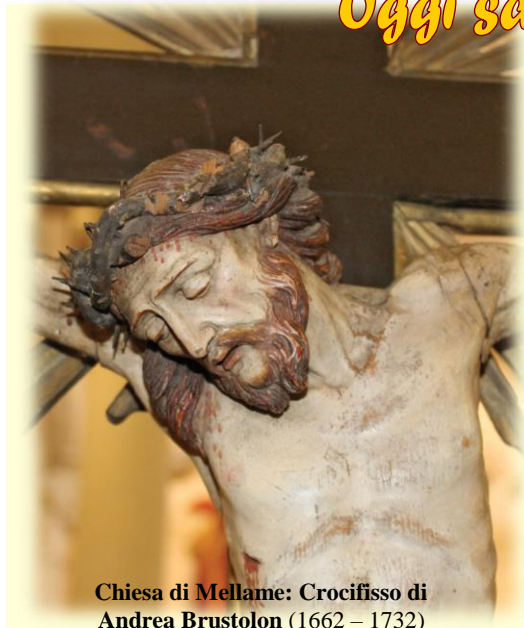
Chiesa di Mellame: Crocifisso di Andrea Brustolon (1662 – 1732)

... L'altro malfattore invece lo rimproverava dicendo: «Noi siamo condannati giustamente, perché riceviamo quello che abbiamo meritato per le nostre azioni; egli invece non ha fatto nulla di male». E disse: «Gesù, ricordati di me quando entrerai nel tuo regno». Gli rispose: «In verità io ti dico: oggi con me sarai nel paradiso». Lc 23,35-43