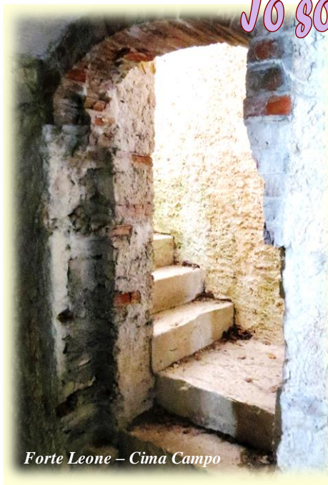
Forte Leone – Cima Campo

... Gesù ancora una volta commosso profondamente, si recò al sepolcro: era una grotta e contro di essa era posta una pietra. Disse Gesù: «Togliete la pietra!». ... Detto questo, gridò a gran voce: «Lazzaro, vieni fuori!». Il morto uscì, i piedi e le mani legati con bende, e il viso avvolto da un sudario. Gesù disse loro: «Liberatelo e lasciatelo andare». Gv 11,1-45