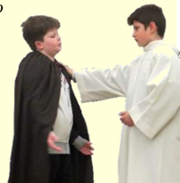
Il cieco guarito – con i ragazzi di 5 a el., 26.3.2017