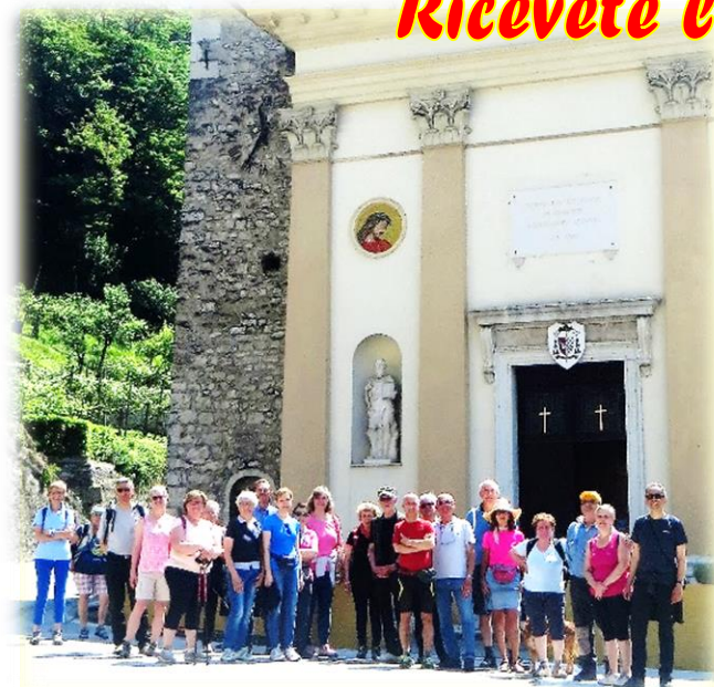
Primolano, 'Rogazioni Mariane', 27.5.2017

La sera del primo giorno della settimana, venne Gesù, stette in mezzo, soffiò e disse loro: «Pace a voi! Ricevete lo Spirito Santo. A coloro a cui perdonerete i peccati, saranno perdonati; a coloro a cui non perdonerete, non saranno perdonati». Gv 20,19-203