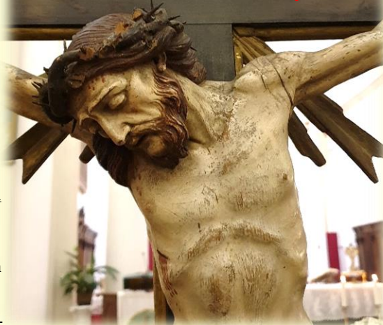
Mellame, crocifisso di A. Brustolon (sec. XVIII)

l'Amore. Qui c'è la consacrazione della dignità di ogni persona; nel suo limite più basso, l'uomo è ancora amabile, perché non c'è nessuno di perduto definitivamente, nessuno che non possa ancora sperare.