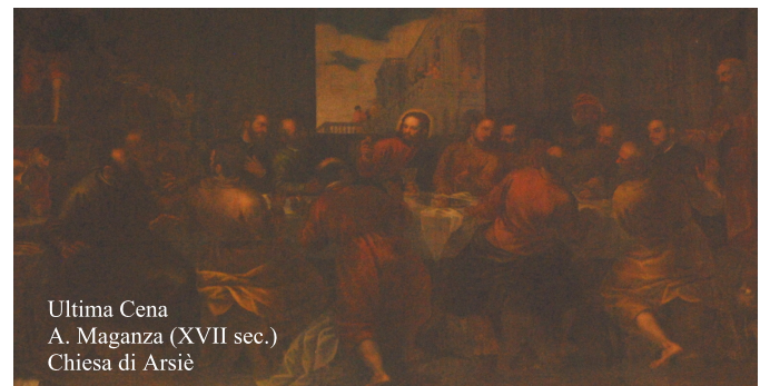
Ultima Cena A. Maganza (XVII sec.) Chiesa di Arsie

La situazione in continua evoluzione potrebbe provocare la modifica di alcuni orari. Norme anticovid, centro ascolto caritas so-speso . Emergenze: giovedì dalle 17,00 alle 19,00 n. 3534185377.