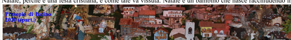
Presepio di Incino 2020 (part.)

sé tutta la potenza di Dio, una presenza che ha cambiato la storia e che può cambiare anche la nostra vita se lo vogliamo, se sappiamo affidarci a lei. Natale è Gesù che vuole nascere in noi, che vuole fare del nostro cuore la sua casa: il regalo più grande è Lui, non quelli magari costosi e a volte inutili che ci scambiamo fra di noi, e che presto si trasformano in giocattoli rotti, in soprammobili impolverati, in oggetti dimenticati in qualche cassetto. Gesù è il dono: una luce vera che dal centro del nostro essere si espande intorno a noi, facendo di ognuno un piccolo sole capace di irradiare gioia, pace, serenità...amore. E' Lui la luce: quel bambino che fa grande ogni piccola cosa, che è nato povero per poterci dimostrare dove sta la vera ricchezza, che si è fatto uomo per parlare alla nostra umanità, trasformandola in qualcosa di grande. Se lo viviamo così, allora il Natale non è più la festa di un giorno presto dimenticata, ma è ogni giorno della vita, perché sempre Gesù è con noi e vuole nascere nei nostri cuori. Buon Natale!