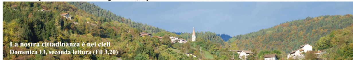
La nostra cittadinanza è nei cieli Domenica 13, seconda lettura (Fil 3,20)