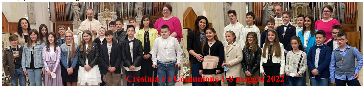
Cresima e 1 Comunione 1-8 maggio 2022

Nel Vangelo di oggi (Gv 14,23-29) Gesù promette la pace , sottolineando che è diversa da quella che dà il mondo. In effetti la pace che noi viviamo - a tutti i livelli, dai rapporti personali in su - è sempre condizionata da compromessi e limitazioni, è sempre ostacolata da opposizioni e disaccordi, è spesso messa in pericolo da invidie, gelosie, rivendicazioni varie. Un vecchio proverbio latino diceva "si vis pacem, para bellum": se vuoi la pace, prepara la guerra. Gesù non la vede in questo modo: quella che egli promette è innanzitutto la pace del cuore, l'armonia con se stessi e con gli altri che deriva dall'ascolto delle sue parole , che vanno messe in pratica nella vita di ogni giorno, a partire dalle piccole cose che sono quelle che, se fatte bene, qualificano e migliorano la nostra vita. Pace e bene a tutti.