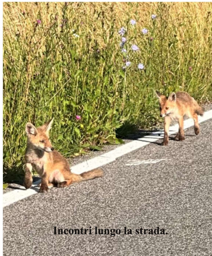
Incontri lungo la strada.

Viaggio in Grecia 5-11 settembre: se c'è ancora qualcuno interessato, è possibile iscriversi per tutto il mese di luglio.