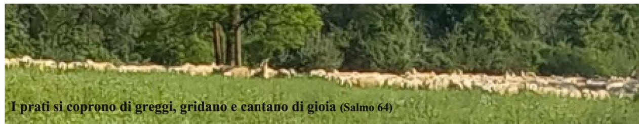
I prati si coprono di greggi, gridano e cantano di gioia (Salmo 64)